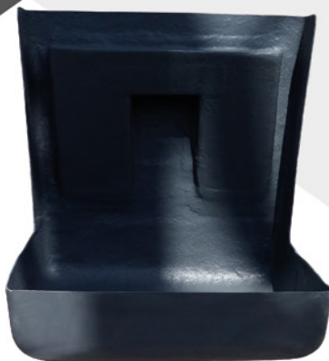
PRODUTOS SOB MEDIDA