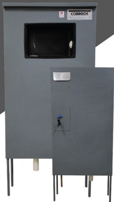
MURETA PADRÃO SAMAE ENTRADA DE ÁGUA